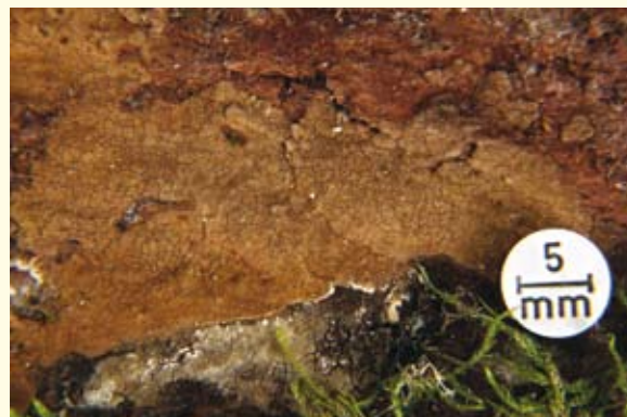
Der Bergahorn-Borstenscheibling ( Hymenochaete carpatica ) bildet einen harten krustigen Belag auf der Rinde vom Berg-Ahorn.

sepilzsammler, Bärtiger Milchling oder Verschiedenfarbiger Täubling den Mykologen. Auch der Föhrenwald mit seinen Sand-, Kuh- und Butterpilzen ist bei günstiger Wetterlage und richtiger Jahreszeit ein sicherer Tipp. Oft deutet ja schon der Name der Pilze auf ihre Baumbeziehung hin, wie das beim Birkenpilz der Fall ist. Die Birke hat aber noch andere vergesellschaftete Pilzarten, etwa den Bärtigen Milchling oder den Kahlen Krempling, doch ist nicht jeder davon ein Speisepilz. Aber den Pilzen ist es ohnehin egal, ob sie dem Sammler Freude bereiten oder ihn umbringen. Sie sind sich selbst genug.