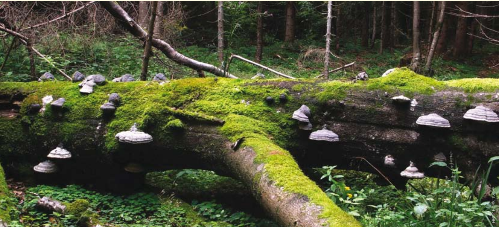
Zunderschwämme verwendete man früher zum Feuermachen.

Diese Verbindung ist vergleichbar mit einer jungen Liebe – man kann ohne einander nicht leben. Aber anders als bei der Liebe, erkalten die Verbindungen zwischen Pilzen und Bäumen niemals. Dabei spielt sich die Baum-Pilz-Symbiose, bei Pilzen heißt sie Mykorrhiza, zum einen streng zwischen zwei Partnern ab, zum andern kann ein Pilz auch mehrere Baumpartner haben und umgekehrt. Dabei werden zwischen dem Feinwurzelgeflecht des Baumes und dem Hyphengeflecht des Pilzes Stoffe ausgetauscht, die der jeweils andere für sein gutes Fortkommen braucht. So hat sich im Laufe der Evolution bei manchen Pilzarten eine strenge Abhängigkeit von ganz bestimmten Baumarten entwickelt. Da viele der gesuchtesten Speisepilze eine Mykorrhiza ausbilden, braucht der versierte Speisepilzsammler nur um diese „Liebe“ zu wissen, um nicht erfolglos dem Wald den Rücken kehren zu müssen. Beispielsweise sind Buche, Eiche, Birke, Föhre, Lärche und natürlich die Fichte mit manchen Pilzen aufs Engste verbandelt. Begrenzt zum Beispiel eine Birkenzeile einen Waldsaum, oder hat eine Gruppe Birken in der Landschaft überlebt, so besucht man diese Habitate kaum ohne Erfolg. Birkenpilz und Rotkappe erfreuen den Spei-