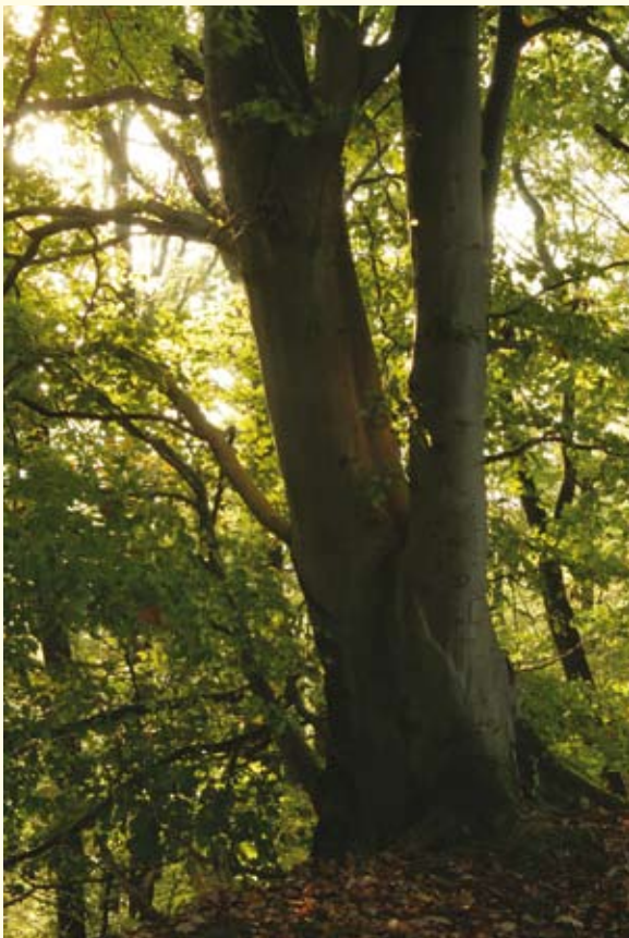
Mächtige Bäume, wie diese Buche, sind in unseren Wirtschaftswäldern nicht mehr allzu oft zu finden.

Durch den von Wissenschaftlern prognostizierten Klimawandel wird sich das Risiko noch deutlich erhöhen. Hauptbetroffen wird davon wohl die Fichte sein. Wegen der langen Produktionszeit in der Forstwirtschaft (60 bis 120 Jahre) kann mit dem Umdenken nicht