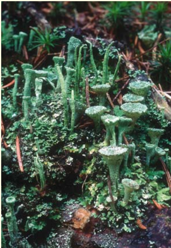
Die Becherflechte ist eine in ganz Europa verbreitete Flechte. Sie besiedelt u.a. morsches Holz.

Ein toter Baum ist für viele Waldbesitzer leider immer noch ein Zeichen schlampiger Waldbewirtschaftung, von dem Krankheiten und Schädlingsbefall ausgehen. Absterbende Fichten in Monokulturen, die nicht rasch entfernt werden, sind tatsächlich oftmals der Ausgangspunkt von Massenvermehrungen von Borkenkäfern, die dann auch gesunde Fichten befallen und zum Absterben bringen. Sterben andere Baumarten ab bzw. ist bei toten Fichten die Borke schon eingetrocknet oder löst sie sich bereits ab, dann geht von solchen Bäumen in der Regel keine Gefahr für gesunde Bäume aus.