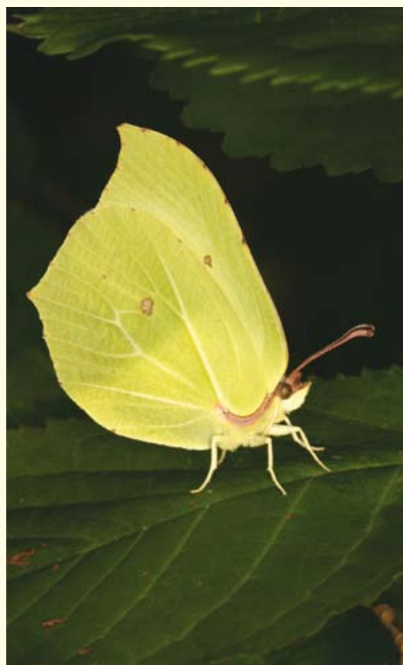
Der Zitronenfalter überwintert im Wald, indem er sich an einer geschützten Stelle einfrieren lässt.

der Holzproduktion. Dadurch sind die meisten Wälder aktuell sehr dicht, was zusätzlich durch die gute Nährstoffsituation auf Normalstandorten, unter anderem durch den Eintrag von Stickstoff aus der Luft, verursacht wird. Dichte und geschlossene Wälder – ein Extrembeispiel ist hier eine Fichtenmonokultur in der Dickungsphase – sind vergleichsweise arm an Insekten.