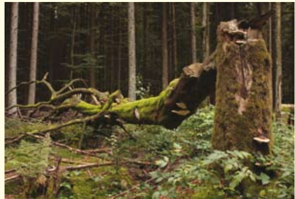
Pilze tragen zu einem erheblichen Anteil zur Zersetzung und Aufbereitung des Holzes zu Humus bei. Darum ist es sehr wichtig, ausreichend Totholz im Wald zu belassen.

Totholz ist eine natürliche Erscheinung und gehört genauso zum Ökosystem Wald wie etwa ein Sämling oder ein vitaler Baum. Bevor der Mensch begann, Forstwirtschaft zu betreiben, konnten in der Urlandschaft über viele Millionen Jahre hinweg Bäume alt werden und absterben, wobei das Holz bis zur Verrottung im Wald verblieb. Zahlreiche Arten konnten sich dadurch auf ein Leben am oder im Totholz spezi-