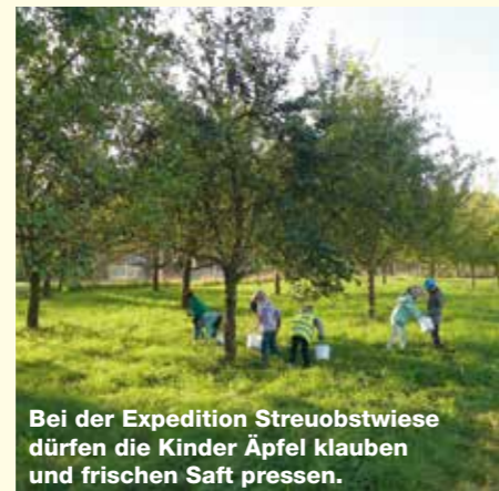
Bei der Expedition Streuobstwiese dürfen die Kinder Äpfel klauben und frischen Saft pressen.