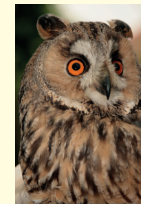
Waldohreule